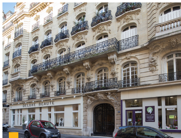
20, rue de Longchamp à Paris (16 ème )