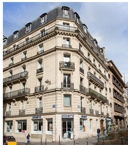
68, boulevard Saint-Marcel à Paris (5 ème )

** Le taux de distribution sur la valeur de marché (DVM) est la division : - du dividende brut avant prélèvement obligatoire versé au titre de l'année n (y compris les acomptes exceptionnels et quote-part de plus-values distribuées), - par le prix de part acquéreur (frais et droits inclus) moyen de l'année n.